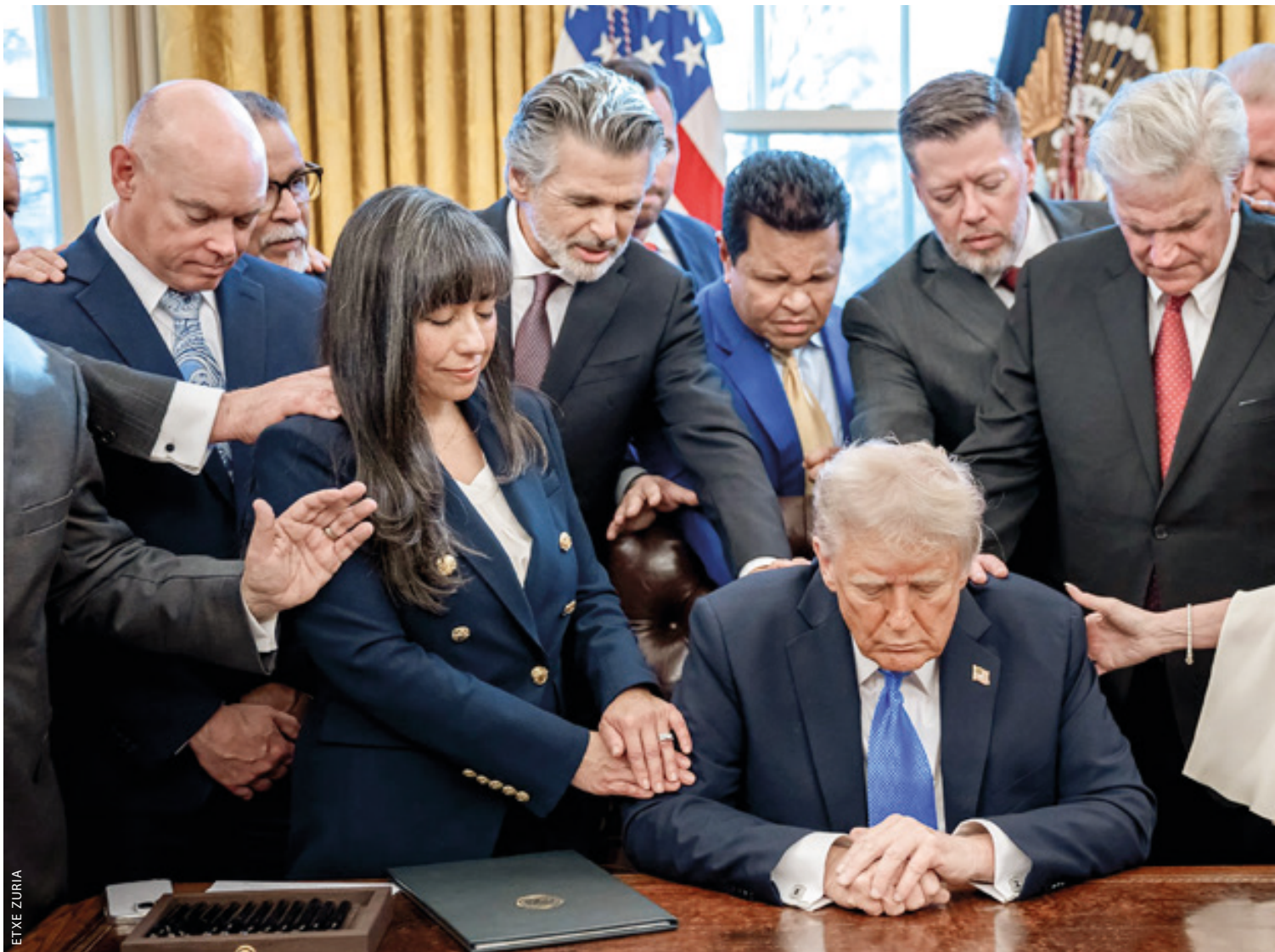
Otsailaren 7an, Trump presidenteak agindu exekutiboan sinatu zuen Etxe Zuriko Fede Bulegoa sortzeko, erakunde erlijiosoak eta gurtza egoitzak sustatzeko asmoz.

ko dira". Eslovakia, Hungaria, Bulgaria eta Georgiarekin ari da hori gertatzen. Europak autonomia bereganatzeko eta Txinako motorra duen esparru euroasiar batean integratzeko aukera dago, eta hori da, hain zuzen, lehian dagoena. Porrot horri atea irekitzea AEBen "segurtasun nazionalaren" hil ala biziko interesen aurkako atentatua da, eta horrek arriskuak dakartzkio saiatzen denari. Ohartarazpen hori irakurri behar da bai AEBetako historiaren testuinguru orokorrean (presidente eta buruzagi politiko okerren eliminazioa barne), bai 2024ko presidentetzarako kanpainaren giro zehatzean, Trumpek bi hilketa saikera jasan baitzituen.